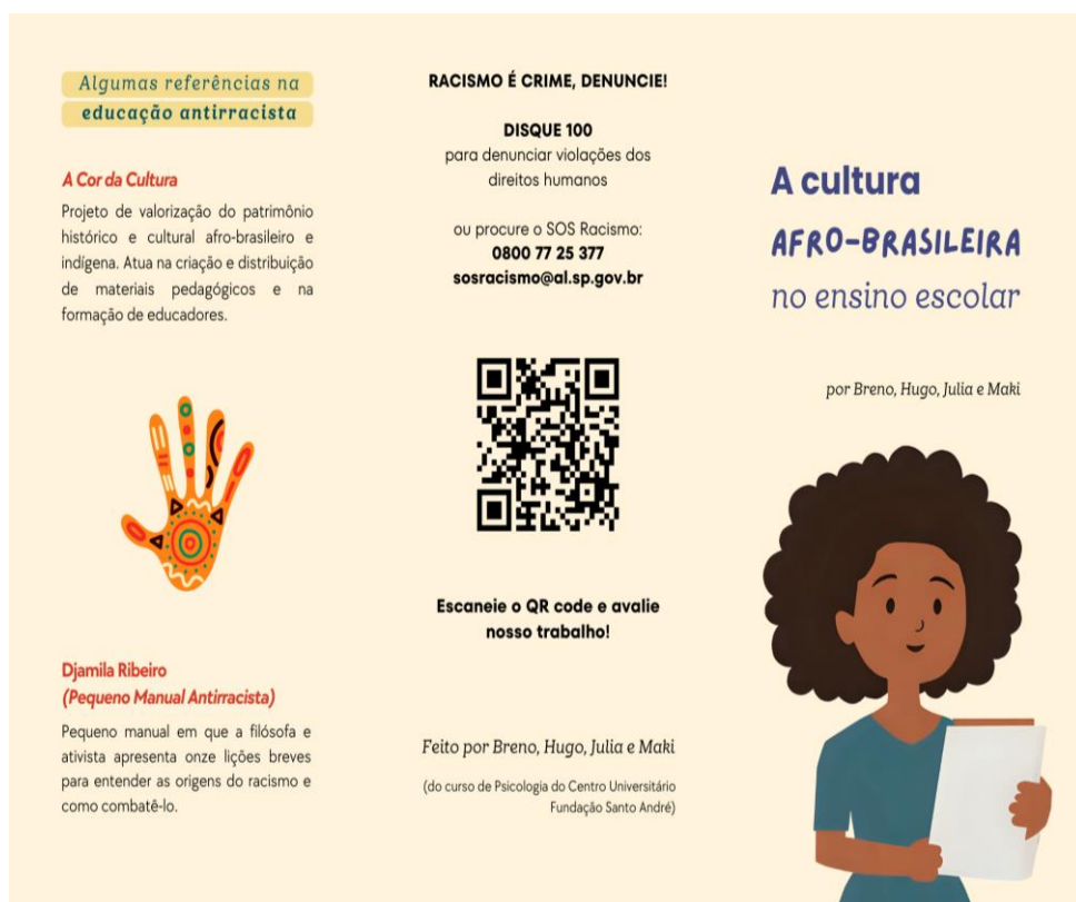
Figura 1 – Folder (parte externa)