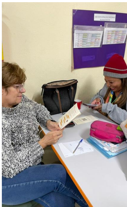
Figura 3 – Distribuição do folder aos participantes

Além de apresentar a legislação, também se destacou a importância de integrar a cultura afro-brasileira ao currículo escolar e como isso contribui para a redução de preconceitos e para uma educação mais inclusiva. Através desse espaço de escuta, houve participação direta do público-alvo (Figura 3).