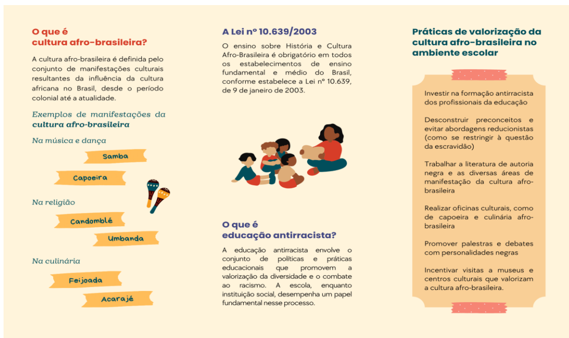
Figura 2 – Folder (parte interna)